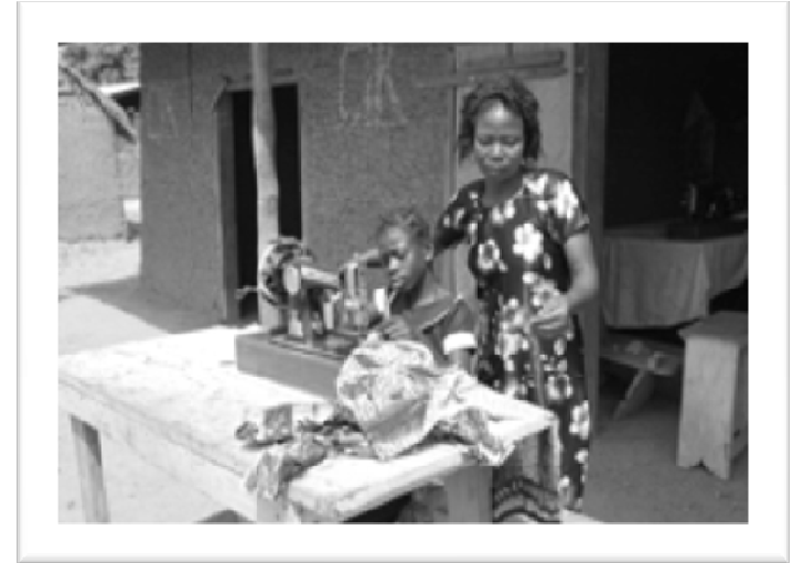
Parochie St. Jan Geboorte Kudelstaart 29 maart 2009